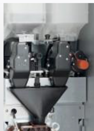
Automatische maalinstelling op topkoffie