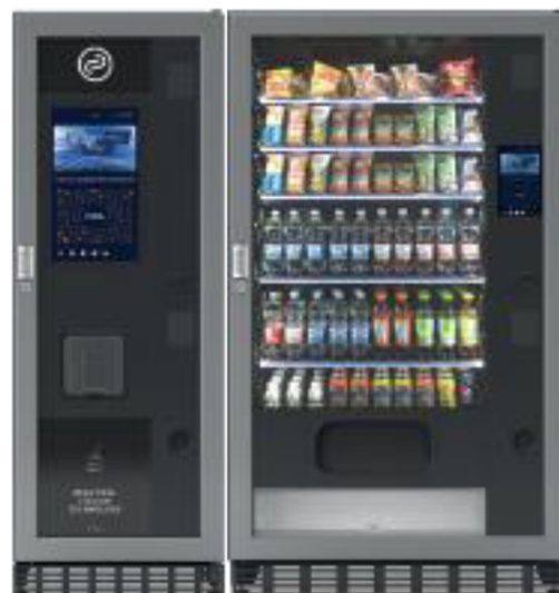
Fas Vicotira + Fas 1050 Pro