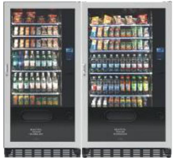
Fas 900 Advanced + Fas 1050 Advanced