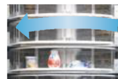
Automatische opening en het sluiten van leveringsdeuren